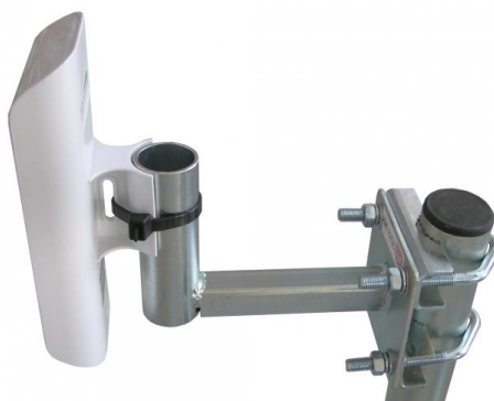
príklad použitia KML107SC